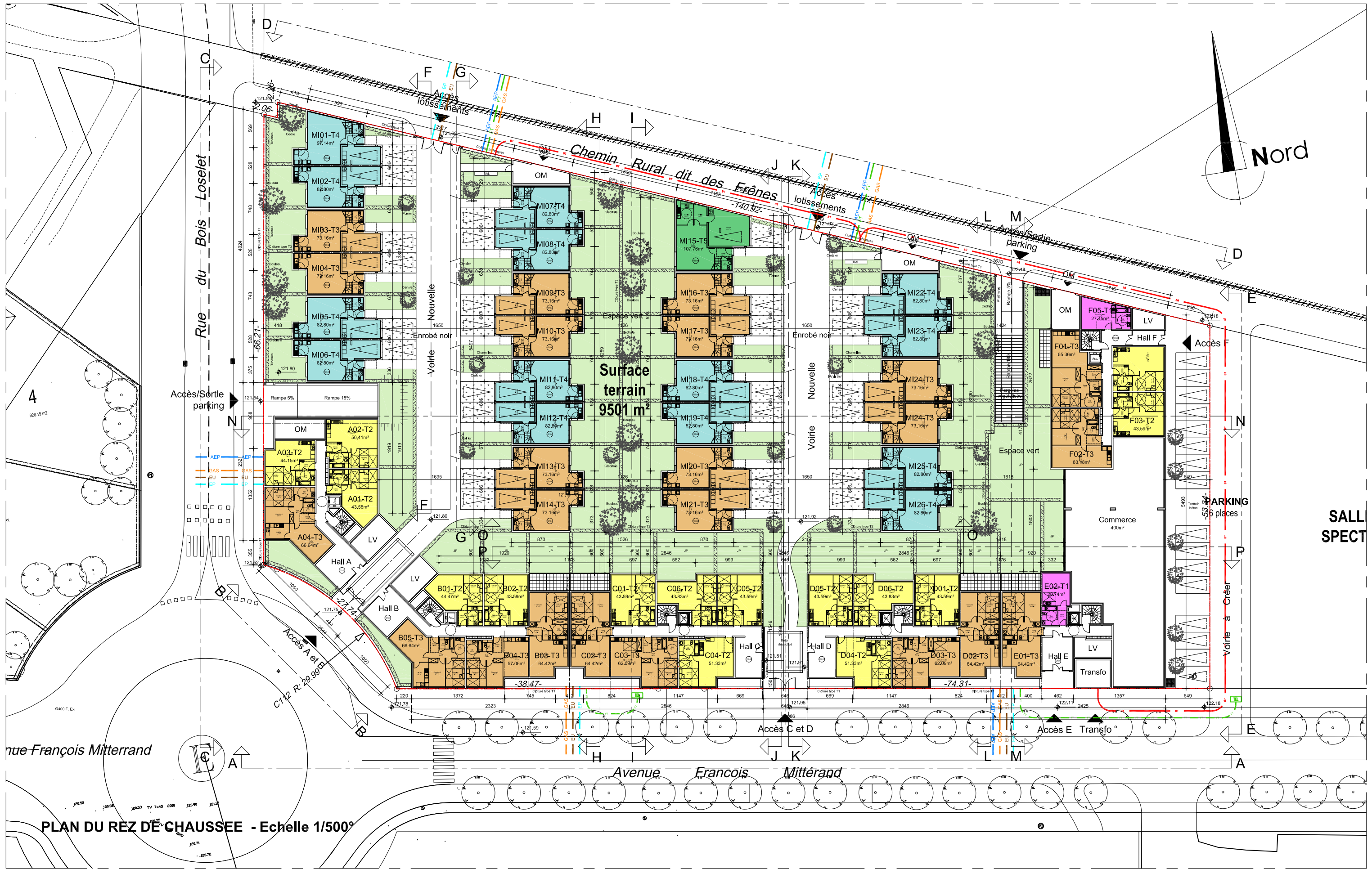
PLAN DU REZ DE CHAUSSEE - Echelle 1/500°