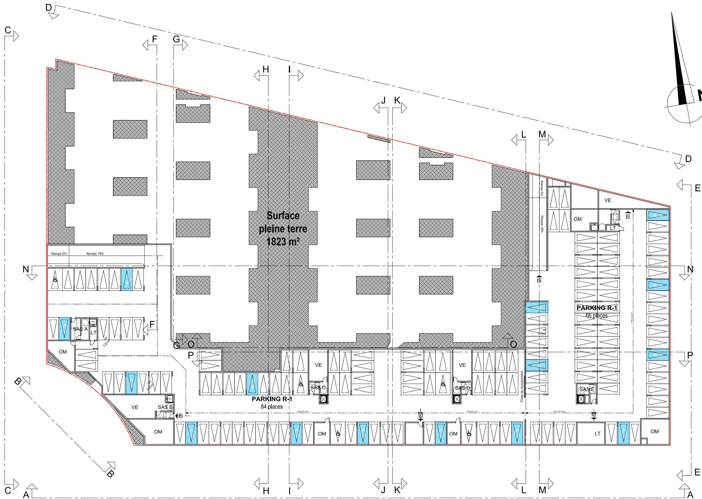
PLAN DU SOUS SOL - Echelle 1/500°