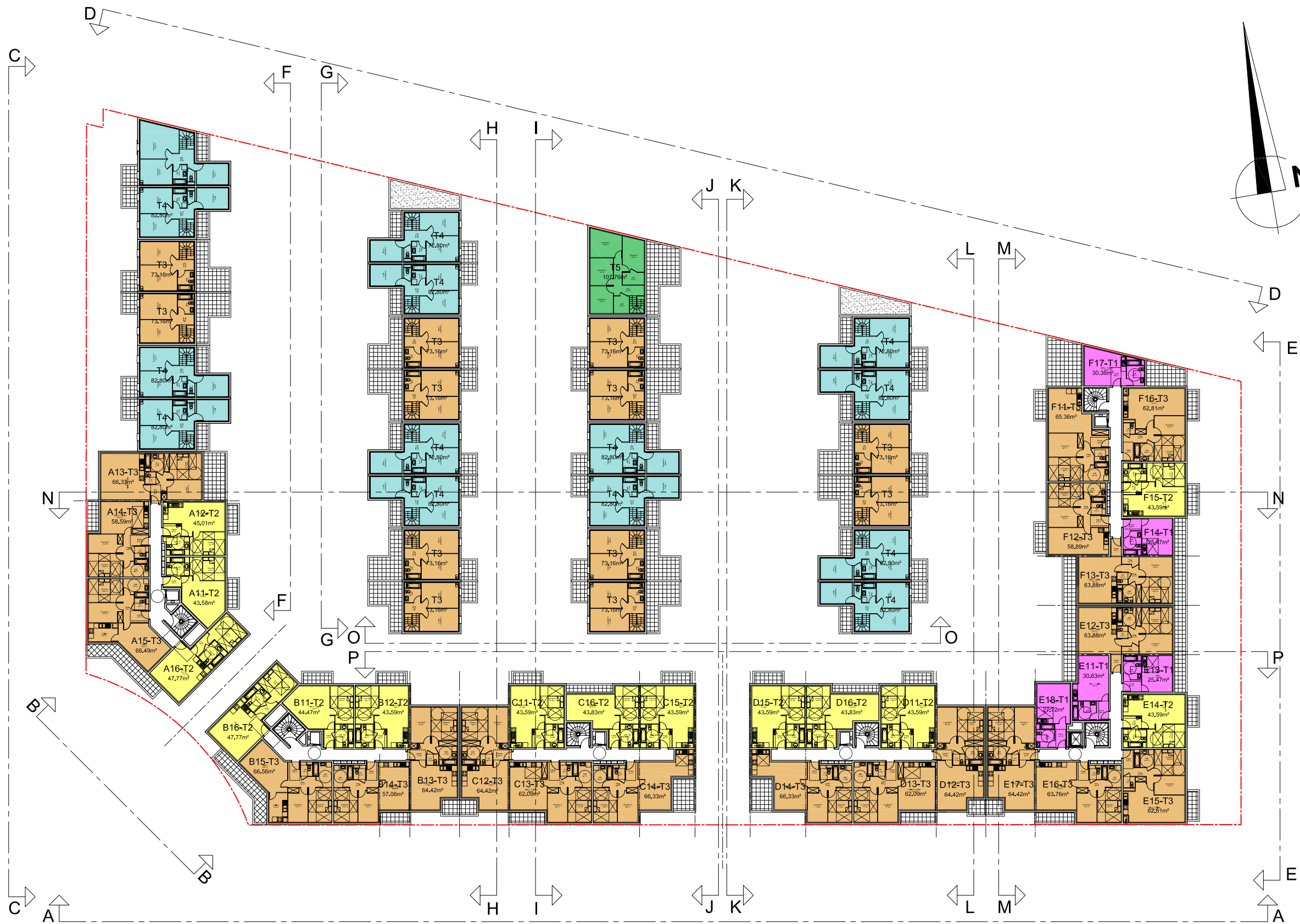
PLAN DU 1er NIVEAUX - Echelle 1/500°